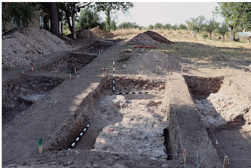
7. Összkép a kutatott szelvényekkel és a feltárt alapokkal