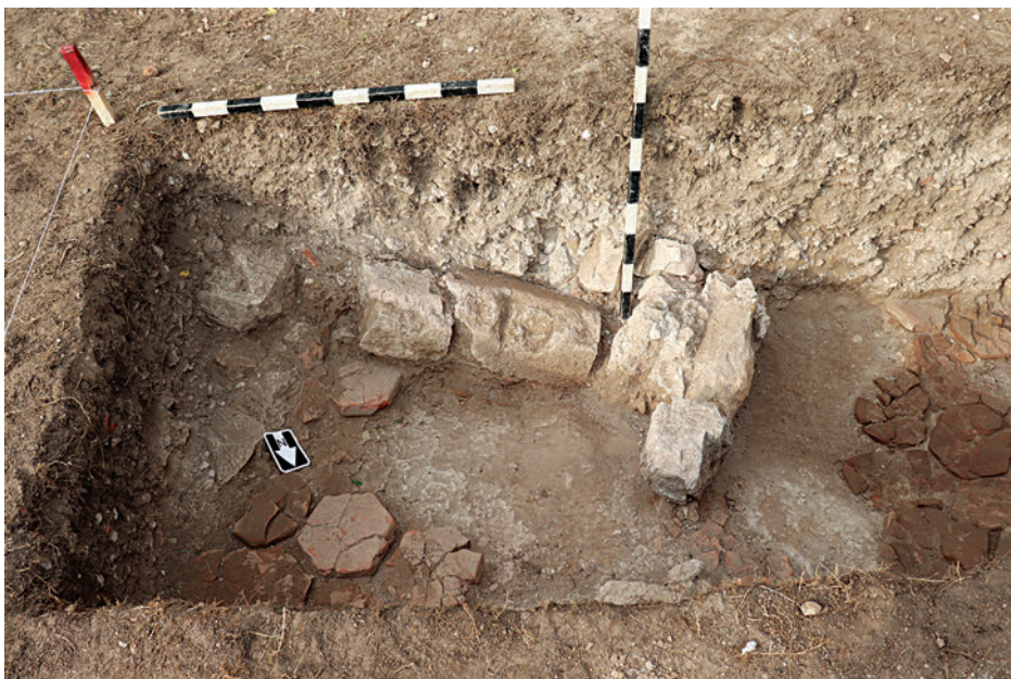
11. Omladék, építészeti tagozatokkal