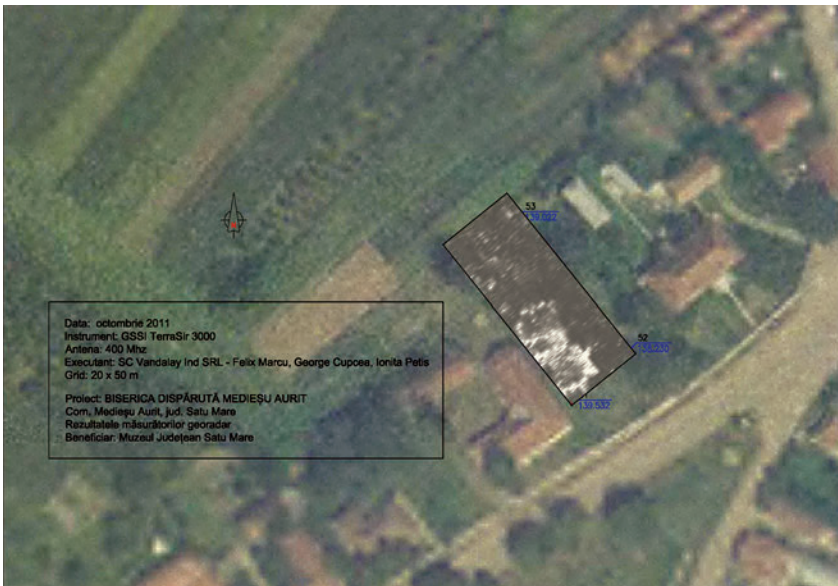
5. Geomăgneses prospecție eredménye