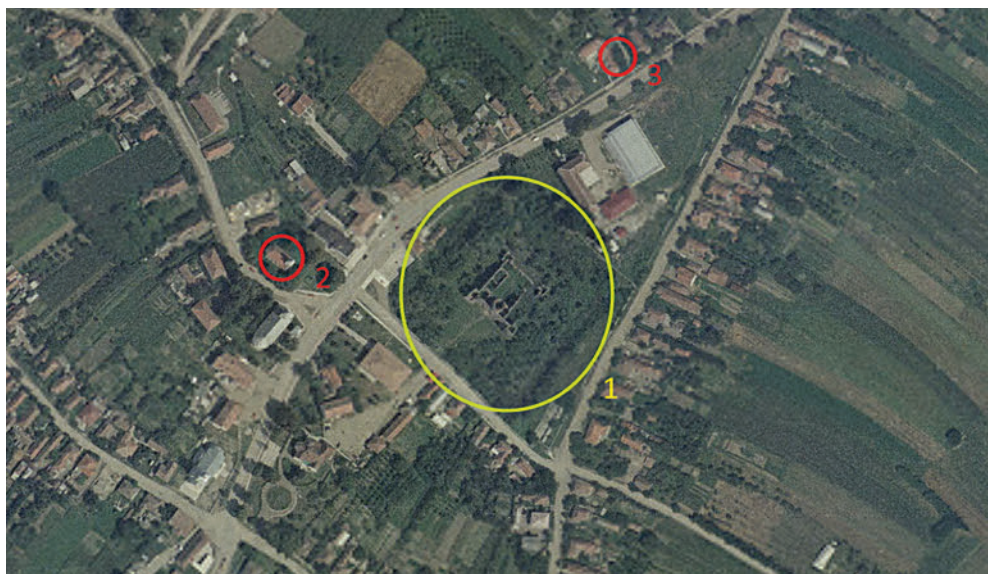
1. Aranyosmeggyes település központja