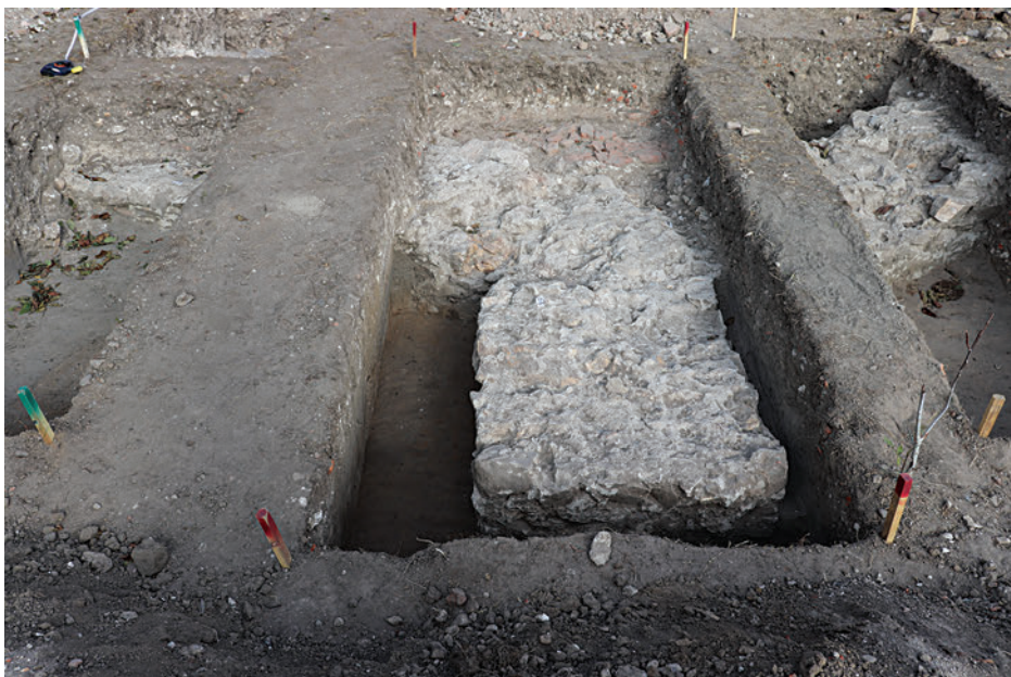
8. A szentély és egy támpillér alapfalai