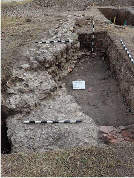
9. A szentélyzáródás alapfalai