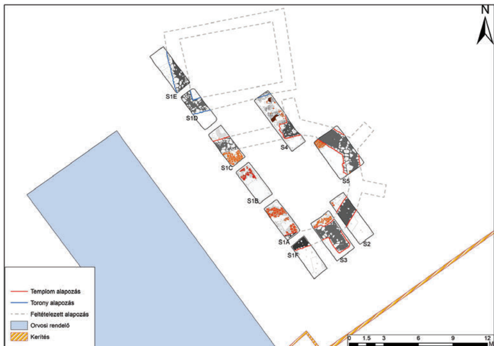
6. A régészeti kutatás felszínrajza