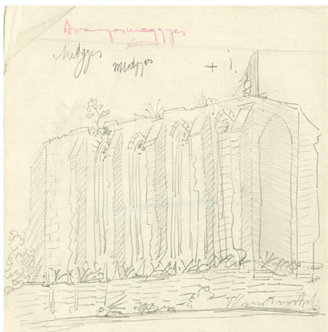
2. A ferences kolostor képe, Schulcz Ferenc rajza, 1864