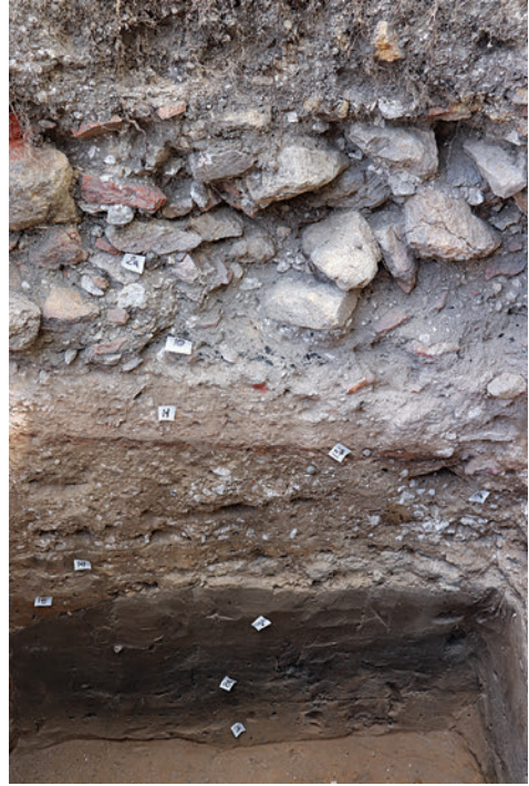
10. Rétegsor a szentélyen kívül, az északi oldalon