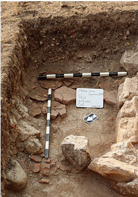
12. A szentélybelső padlója hatszögű téglákból