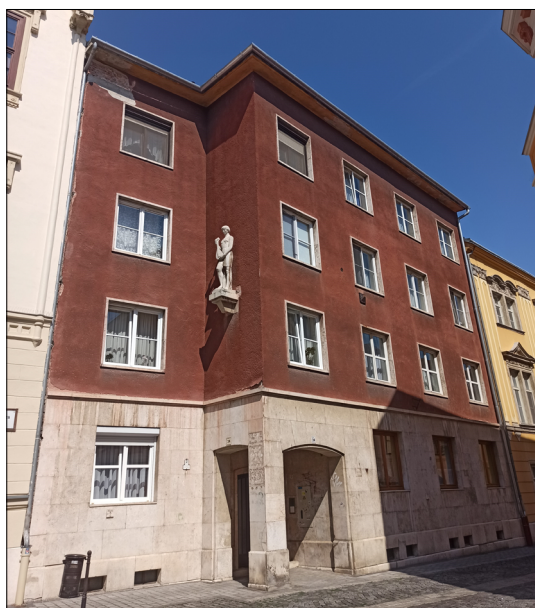
3. ábra. A Templom utca 24. számú lakóház

elfogadta. A bizottság megállapította, hogy az agyaghoz viszonyítva a gipsz formailag és tartalmilag egyaránt fejlődött. Az „ábrázolás szellemének kissé idealizáló megfogalmazására” 23 000 Ft tiszteletdíjat állapított meg. Erre való tekintettel 1960 novemberében Sopron Városi Tanács Ipari és Műszaki Osztálya a Magyar Népköztársaság Képzőművészeti Alapját felkérte a szobor süttői fehér mészkőből való kivitelezésére. A fent említett bírálóbizottsági üléseken az OMF meghívottjai nem jelentek meg.