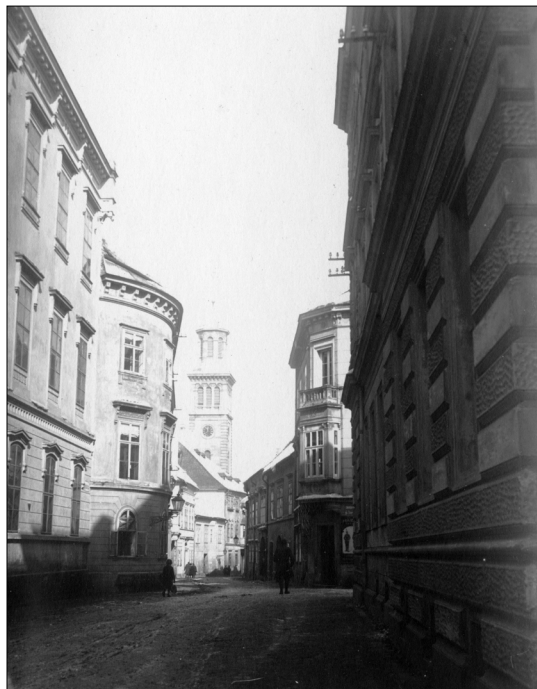
1. ábra. Templom utca, háttérben az evangélikus templom

A jelenlegi épület eredeti építésügyi hatósági iratai a Magyar Nemzeti Levéltár Győr-Moson-Sopron Vármegye Soproni Levéltárában található meg [8]. A három doboz a záradékolt építési engedélyt, a használatbavételi engedélyt, valamint az eljárások előzményiratait (jegyzőkönyvek, levelezés, műszaki leírás) tartalmazza. Ezen iratok tanulmányozása alapján a következő építéstörténeti leírás állt össze.